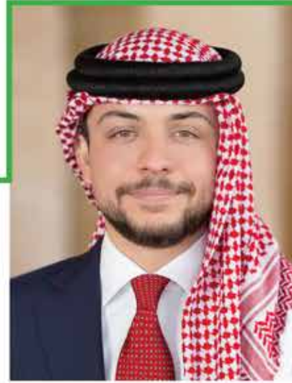
ولي العهد الأمير الحسين بن عبدالله

”نحن لا نطلب من المجتمع أو المسؤولين أن يخلقوا لنا الفرص، ما نريده هو أن يوفرُوا البيئة التي تسمح للفرص أن تُخلق؛ بيئةٌ تستقبل الريادة بأيادٍ رحيمة، تحتضن الإبداع بلهفة، وتقدر المواهب. ما نحتاجه هو أن تُترك لنا المساحة لننطلق دون قيود أو محددات، التقاليد والمبادئ الأكثر استدامةً هي التي تتطور وتواكب تغيرات العصر. لذلك، علينا أن نعزز في شبابنا قيم التغيير والتجديد لا الانقياد والتبعية، الانفتاح لا الانغلاق، قيم حرية الاختيار والإبداع لا الاتكالية. هذا ما علمني إياه والدي، سيدنا“